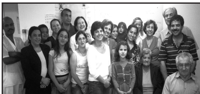
Núcleos Água Verde e Vila Fanny, reunidos na congregação em 30 de outubro de 2007.

Atenção: A última semana de reuniões dos Núcleos nos lares será a de 18 a 24/11/07!